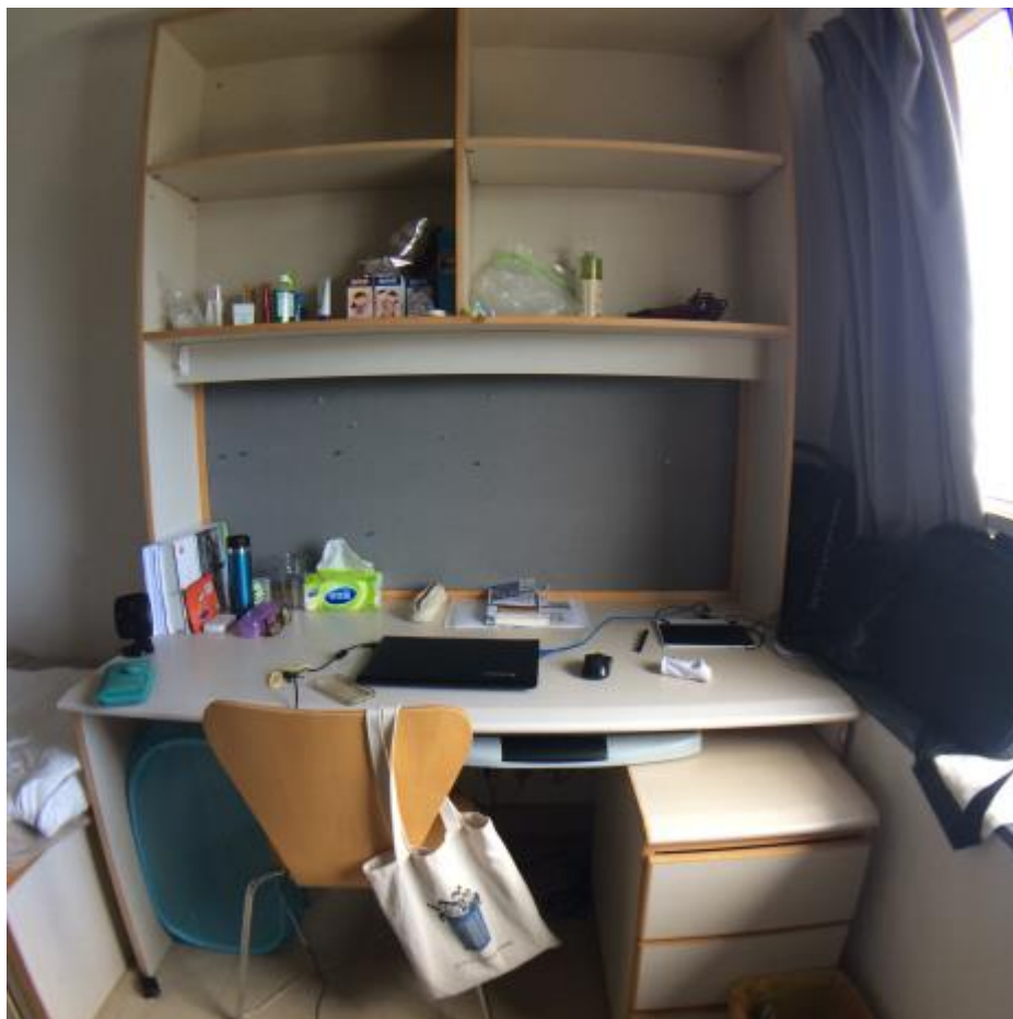
這是我的書桌，桌的右上角有檯燈，可以不用再去買，我覺得很棒！