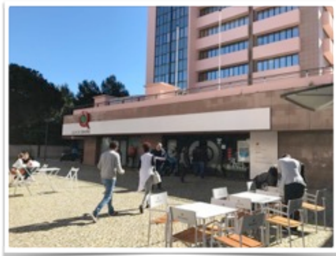
Larangeiras附近的LOJA DO CIDADÃO

* * * 特別注意：Finanças的辦事效率真的非常慢，建議8:30剛開門就去排隊辦理