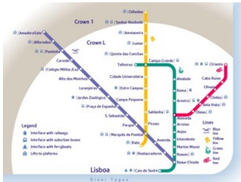
里斯本metro圖，zone L才是月票可使用的範圍

綠線Cais do Sodré—海鮮市場Time Out Market、前往Belém區公車轉乘、Cais do Sodré火車站(往Cascais)、渡船站(往Cacihalas，再轉乘公車或步行可抵達耶穌像)