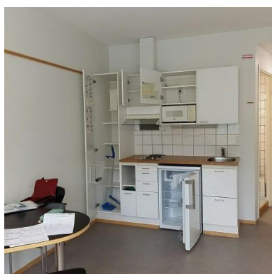
▼ 圖三： 廚房及餐桌

進門之後其實就是簡單風格的套房，空間其實滿大的，廚房和房間連在一起沒有隔開，煮飯的時候油煙的處理就比較麻煩，我自己會把窗戶打開通風，而且剛好我這間房間的抽油煙設備還不錯，所以並沒有這方面的困擾。我同學雖然是住 MOAS2 的雙人房，格局是兩個人各自的雅房，共浴一間浴室以及廚房，廚房和房間雖然有隔開，但抽油煙設備卻好像沒什麼作用，反而在煮飯炒菜的時候味道超重的，久久不能散去！MOAS 1 單人房的廚房設備包含兩個電磁爐、一個微波爐，以及一個冰箱（如圖三），旁邊有非常多的收納櫃，不論是鍋碗瓢盆或生活物品都有非常足夠的空間。