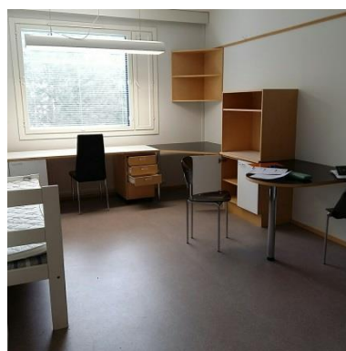
▼ 圖四： 書桌及床

廁所的部分如圖五，淋浴設備基本但很實用，住在這裡的每一天都有非常充足的熱水可以洗，從來就沒有被冷到過！另外，可以看到途中左下角有一個白白的方形，這就是歐洲常見的暖爐，但 MOAS 宿舍的暖爐好像是統一開啟與關閉的，所以一直到我離開芬蘭前好像都沒有感受到。