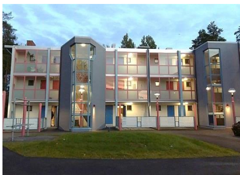
▼ 圖一：MOAS 1 外觀

再來就簡單談談我所住的宿舍吧！我是住在 MOAS 1，位置是全部 MOAS 宿舍中離學校最近的(早上起床快走大約八分鐘)。MOAS 的每一棟樓都是三層樓，完全沒有電梯(如圖一)!!!!因為我自己就剛好住在三樓，在剛開始抵達 MOAS 的時候只能用扛的把所有的行李帶上去，一個欲哭無淚 QQ。剛開始可能會覺得走廊暗暗的有點陰森(如圖二)，但其實真的只是還沒有習慣「大自然」。房門的部分 Janitor 會給一把鑰匙，每天出門都一定要記得帶在身上，通常門一關起來就會自動上鎖(除非把門旁的按鍵重新設定，就像車門的安全裝置一樣)，打電話請 MOAS 的人來開門可是所茲不斐。