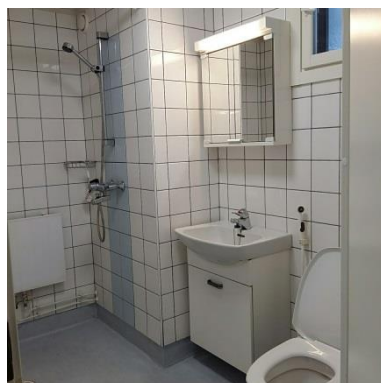
▼ 圖五： 廁所與衛浴設備

另外關於垃圾場以及地下室的桑拿以及洗、烘衣機，因為之前有看過別人分享過所以就不在這邊廢話囉！