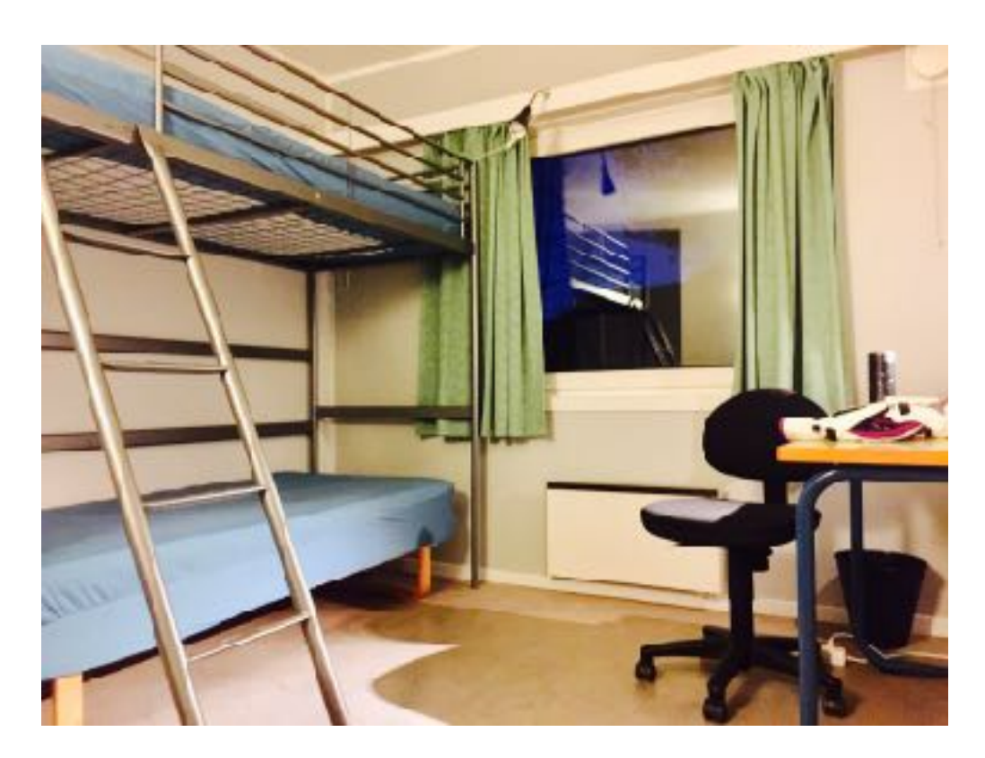
Hatleberg F Block