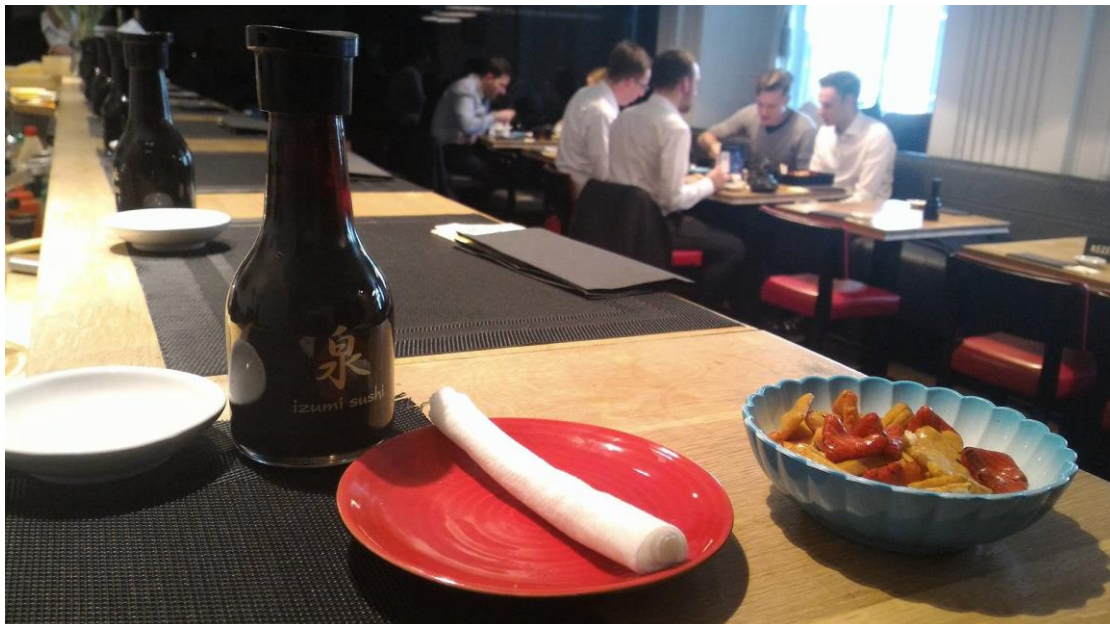
圖四、位於 Charlotte 正對面的泉壽司內部

一入座後服務生會端來一份濕紙巾跟一盤米果零嘴，這時候可以開始考慮要點什麼樣的壽司，直接向吧檯的師傅點餐。