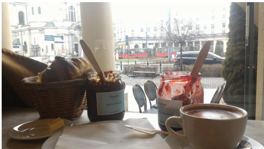
圖三、Charlotte 靠窗的位置視野