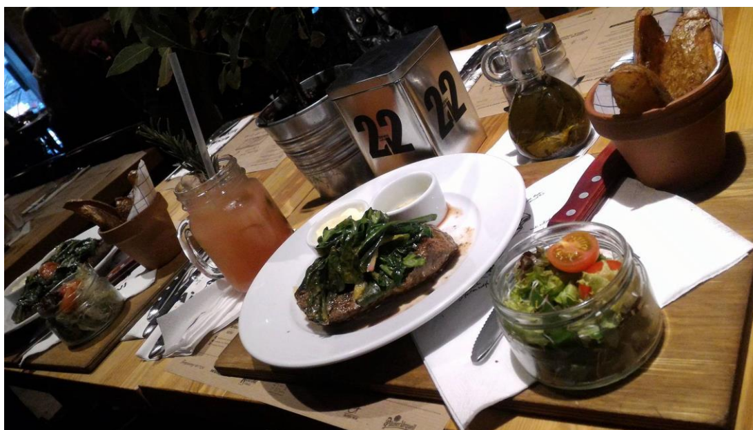
圖二、Politechnika 附近的 AiOLI inspired by MINI

早上從 9:00 開始營業，常常到 10 點、11 點迎來高峰流量的 AiOLI mini，早餐時段有一個沒有標註在菜單的優惠，就是點一杯咖啡類飲品，只要加 1 茲羅提就可以選擇一份早餐套餐，雖然是看似半買半相送的套餐，有香腸套餐、鮭魚套餐等等，要不是分量不小，就是非常好吃，誠意十足！