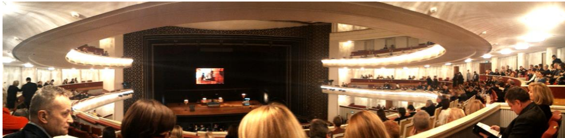
圖四、波蘭華沙之國家歌劇院表演廳內部

就像我們的國家戲劇院一樣，場地非常古典、優雅，所以最好不要穿著正式一點的服裝。表演廳的觀眾席有分很多等級，不同等級不同價位，而學生證可以得到不少的折扣，但一定要提前訂票！