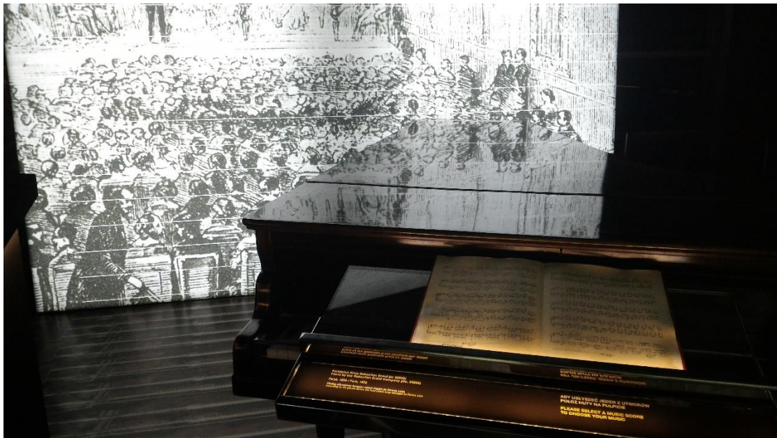
圖二、蕭邦博物館內依參觀者選取之琴譜自動彈奏的鋼琴