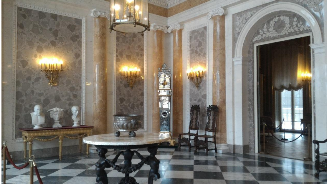
圖二、維拉諾夫宮內一景