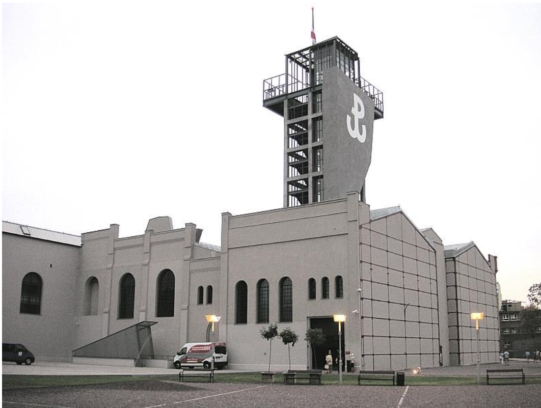
圖三、華沙起義博物館

在二戰期間 1944 年，華沙曾經有大規模的起義，這間博物館內存放許多與二戰相關的影像、圖文紀錄，除了了解二戰期間華沙的起義前的籌備、那陣子人民的日常生活、書報之外，也可以看見他們的民族是如何在那段時間內被壓迫，乃至於空攝呈現二戰結束後 80% 的華沙被炸燬的樣貌。