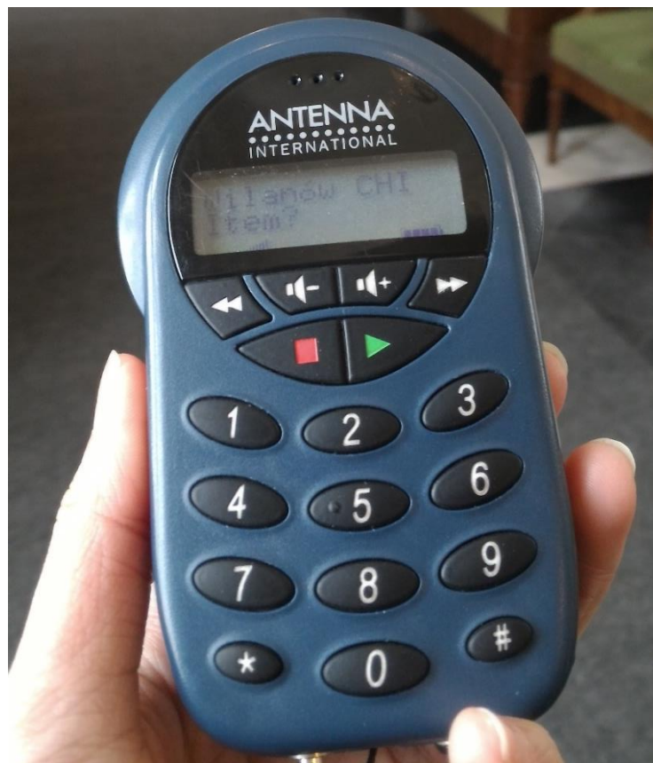
圖一、維拉諾夫宮的語音導覽器上顯示著服務人員輸入的我的姓氏

皇宮本身以作為博物館展覽用途，而皇宮外的花園在春夏秋有繁茂的花景，冬季則有架設燈光藝術裝置，是四季皆宜的華沙 NO.1 的參觀景點。