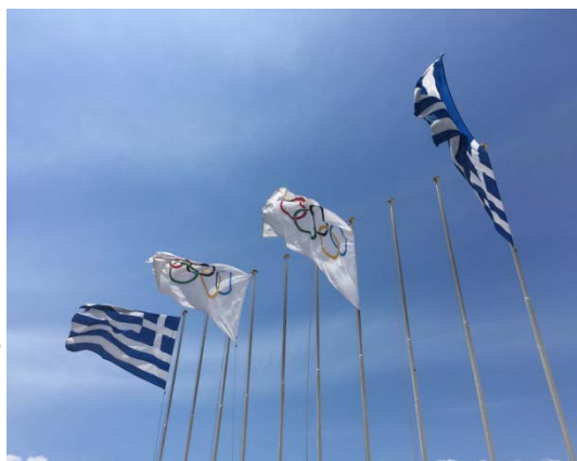
雅典奧林匹克運動場

由於我沒有買歐洲各國的網路，所以我喜歡先把自己想去的景點標記在 Google map 上面（可以用星號/愛心/綠色標籤分隔景點/餐廳/交通站牌），再把地圖下載下來，除了 Google 提供的地圖，Maps.me 也是一個很方便的離線地圖工具，特別適合登山等戶外活動，因為他對於小路的精細程度非常之高；另外，也下載 Google 離線翻譯和當地語言的鍵盤，以備不時之需。