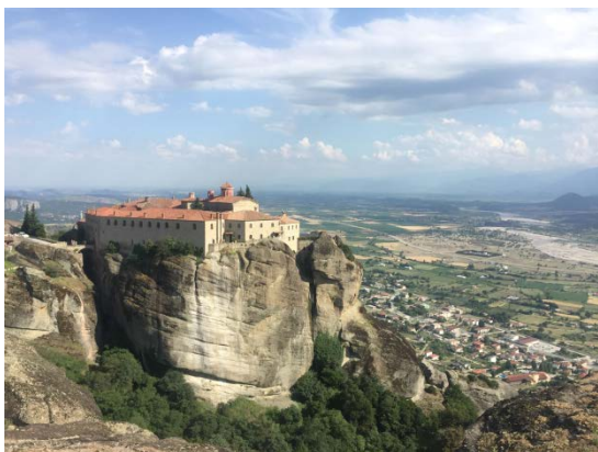
希臘 Meteora 天空之城 東正教修道院

在不翹課和有限的預算下，5 個月內我去了 12 個國家，和當地人與其他旅行家交流的過程中，認識到更深一層的自己，除此之外，「歐盟學生」的身份讓我享受很多福利（巴黎羅浮宮免費、巴黎凡爾賽宮免費、雅典衛城免費、多數景點有學生價優惠.....等），學弟妹們好好把握！