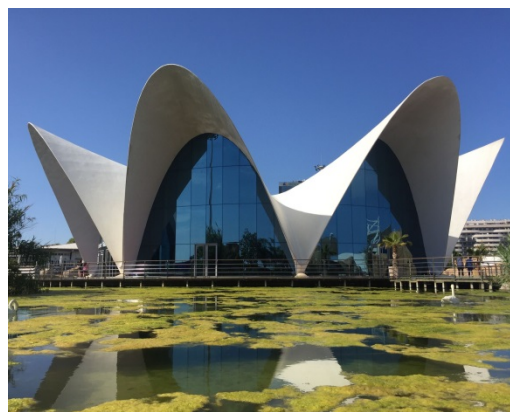
西班牙瓦倫西亞水族館