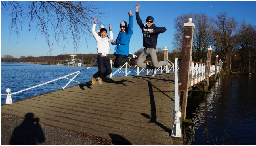
太陽出來時，天氣超好的