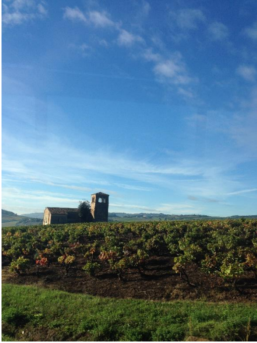
<<沿途的葡萄園風光