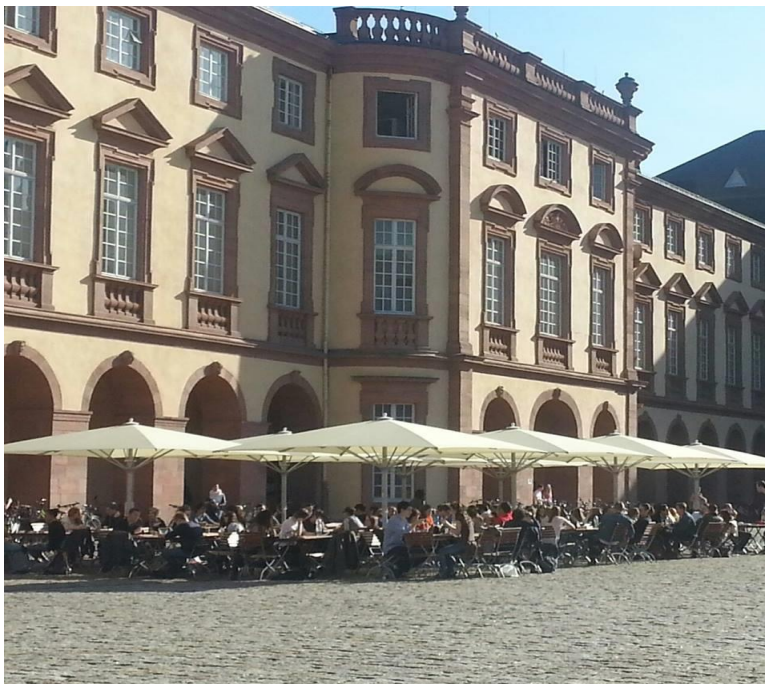
圖 2: EO 外

EO 也是校園內學生常去的餐廳，裡面音樂非常大聲、食物也較貴，是稱重計價。夏天時常有學生坐在 EO 外面討論報告或是放鬆聊天。(如圖 2)