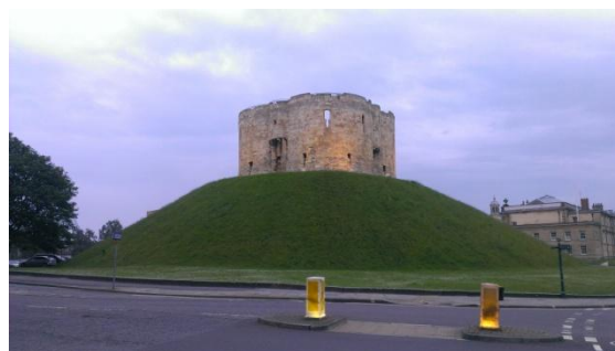
➤ York Minster 和 Clifford Tower