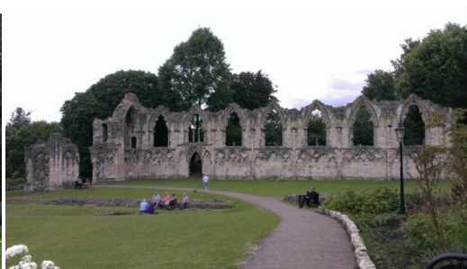
➤ Yorkshire Museum 和 St. Mary's Abbey