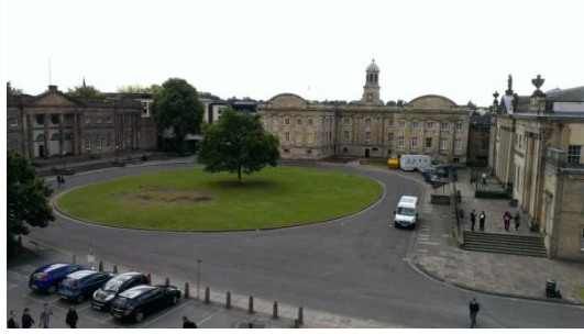
➤ York Castle Museum