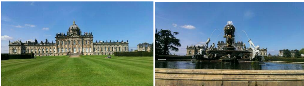
➤ Castle Howard 景緻

York的郊區有一座至今還有人居住的castle。來回車票加上城堡和花園的門票總共£15左右，去的時候在城裡的Picadilly車站搭乘181號公車，買票時記得出示車票，可以抵部分門票的費用。