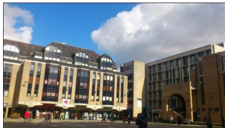
照片中右側那棟大樓即為學校行政大樓

至學校的行政大樓，跟著指標到達二樓所設置的報到處，會有學生指引你填寫資料；而在填寫完資料後就到樓下找行政人員完成註冊。