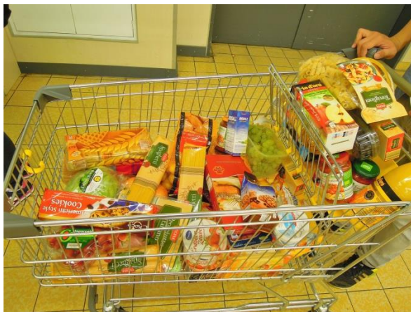
(一次都買超級多，德國 25 歐以上可退稅喔)

如果要買肉或蔬菜可以在星期四晚上搭火車到德瑞邊境的 Konstanz(開到十點)，一出車站就有 Lago 大型商場，裏頭的 Aldi 可以買到便宜的食物，或是可以搭公車(2.2 歐)到遠一點的 Kaufland，這家是我覺得最大最好買的超市，東西都很便宜，很多學生都會到邊境採買一個月的存糧。