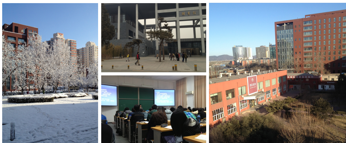
(左) 春雪裡的明德樓 (中上) 新建圖書館 (中下) 正在上課的教室 (右) 宿舍窗外一隅

二、修課：在中國的高等教育裡，授課方式還是停留在較為傳統的宣講模式，大部分的課程老師教授知識，僅有少數課程有小組報告、個案討論、多媒體教學等較靈活的互動學習，然而，人大的教授們普遍具有非常專精的學術知識，且授課流暢、表達能力極佳，若是能夠配合老師的課程規劃、用心準備考試與作業，便可以有滿載而歸的收穫。必須強調的一點是，人大學生上課都非常準時，我交換的期間不曾見過老師等同學上課的情況，上課前十五分鐘同學幾乎就已經在教室坐定，再加上人大校園頗大，所以一定要把握跑堂的時間，以免成為受眾人矚目的遲到學生。至於課程評量，教授還是比較注重出席率、以及考試，筆試也會出現名詞解釋、簡答題等制式化的題目，建議考試前先請教課堂學生老師的出題偏好、答題技巧。