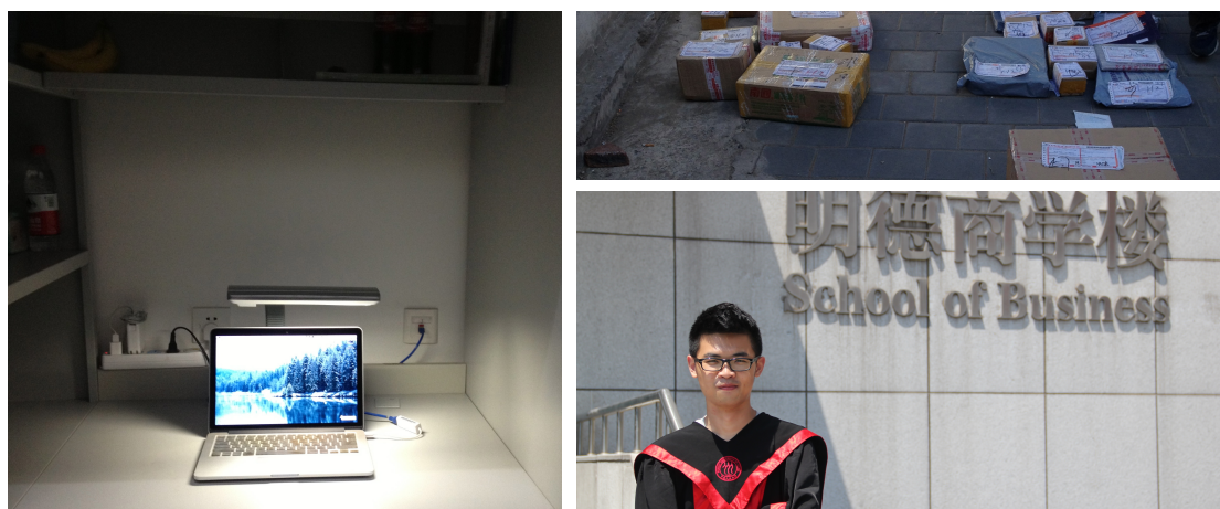
(左) 宿舍書桌與系統格格不入的Mac (右上) 知行樓後的快遞件 (右下) 著人大學士服留念

三、如果回台前行李超重：中國有順豐、圓通、中通、韻達、郵局空運、EMS等快遞服務公司，若是要從北京寄行李到台灣，可以找較有保障、費用也相對便宜的順豐快遞。寄行李時，能夠先向快遞公司索取免費紙箱，行李過多時，或許可以嘗試向快遞員爭取折扣。惟一需要注意的是，順豐快遞不收磁鐵、玻璃、食品、飾品等件，另外，千萬不要貪小便宜使用快遞公司的物流服務，物流與快遞是不同的兩個概念，物流服務沒有查詢單號、無法保證寄送時間、丟失貨品風險大、也不能送貨到府。