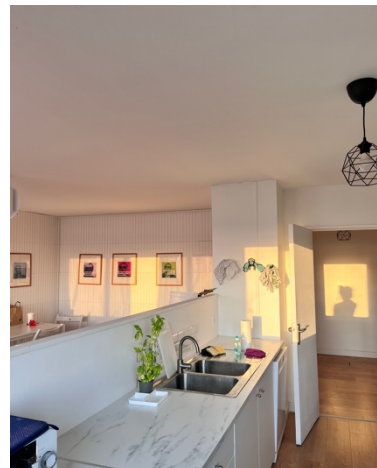
住的 flat 的客廳跟廚房